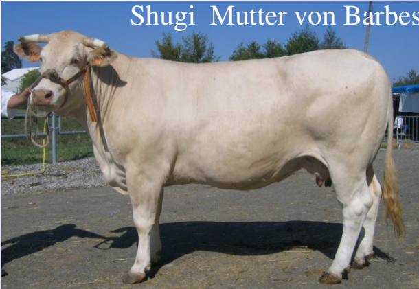
Shugi Mutter von Barbès