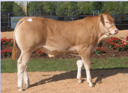
DIONYSOS au concours national (Auch 2008)