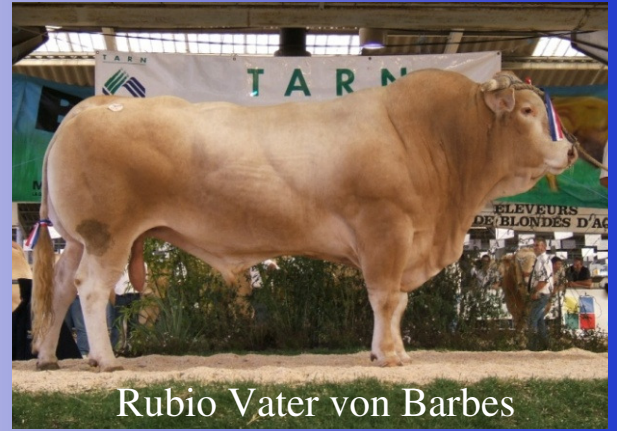
Rubio Vater von Barbès