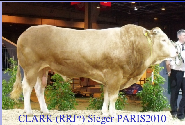
CLARK (RRJ*) Sieger PARIS2010